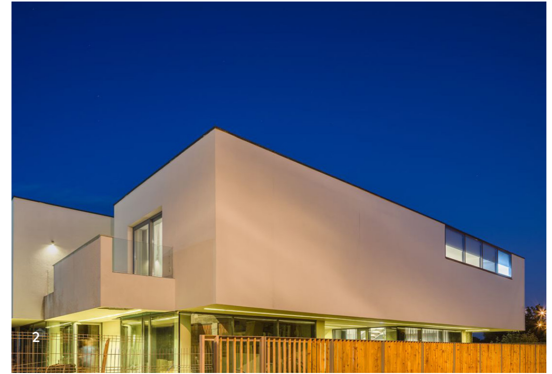
2 Fațadă Facade