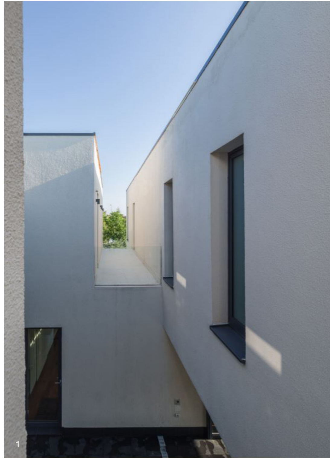
1 Fațadă Facade